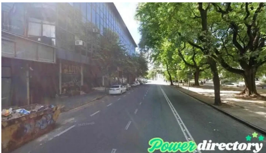
La mutual santa fe de la vera cruz