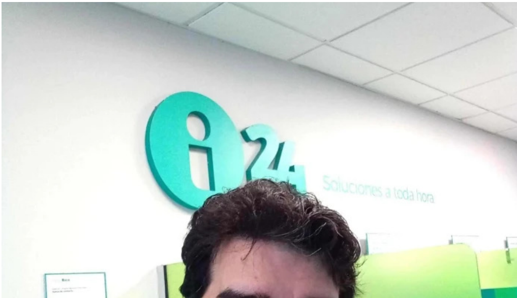
Banco bica santa fe de la vera cruz