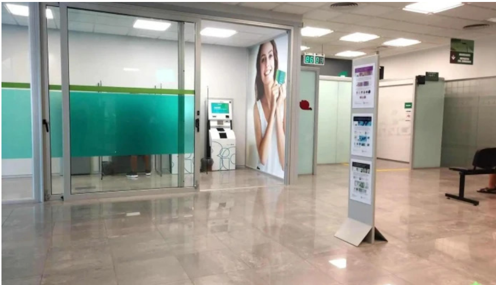
Banco bica interior