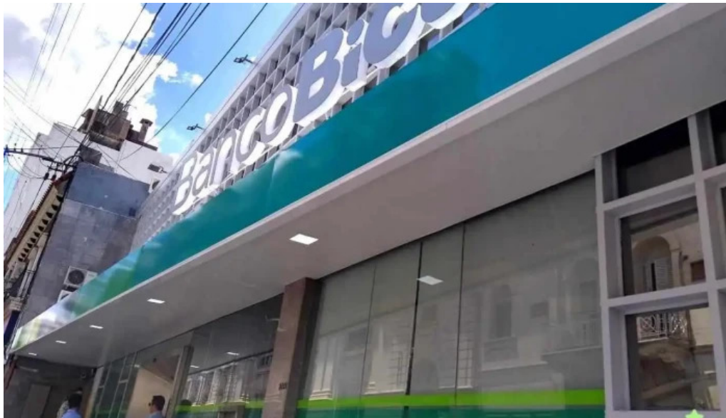
Banco bica exterior