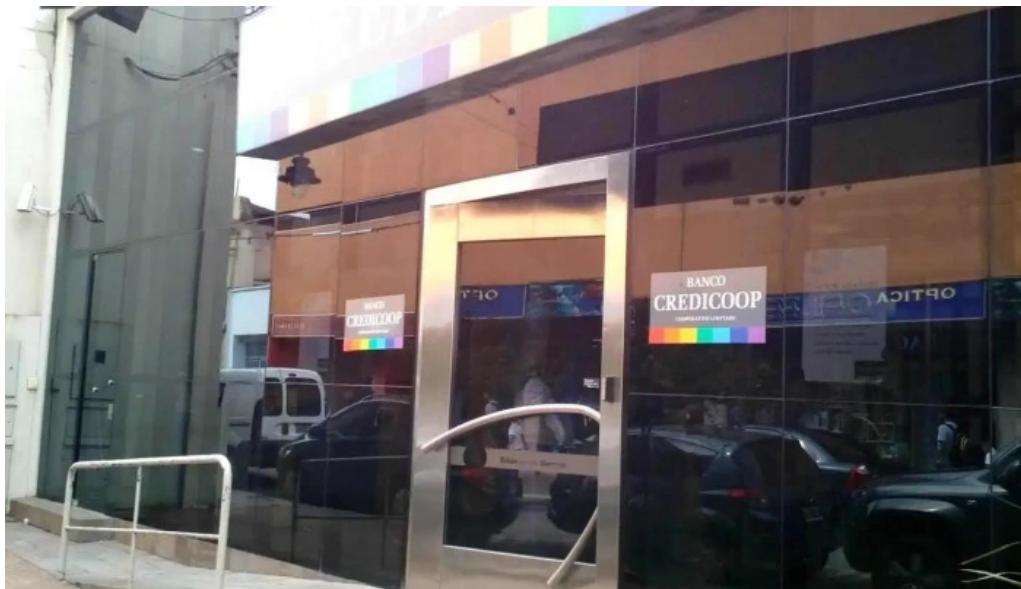
Cajero automatico banco credicoop jujuy exterior