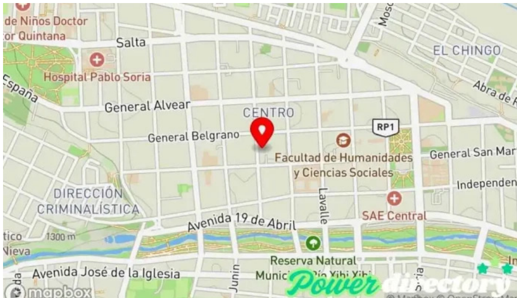
Cajero automatico banco credicoop jujuy mapa