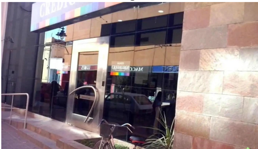
Cajero automatico banco credicoop jujuy san salvador de jujuy