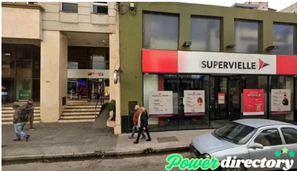
Tarjeta morada san miguel de tucuman