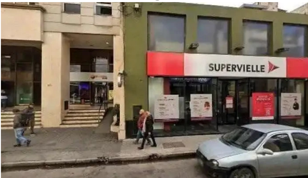
Tarjeta morada ubicacion