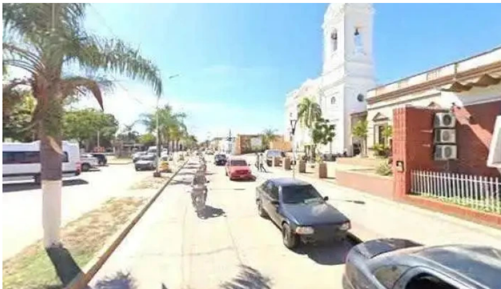
Banco de la nacion argentina instagramdeg