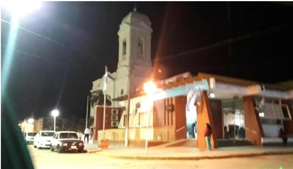
Banco de la nacion argentina exterior