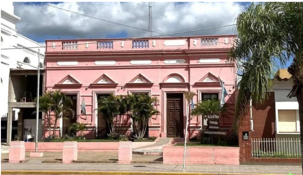
Banco de la nacion argentina san luis del palmar