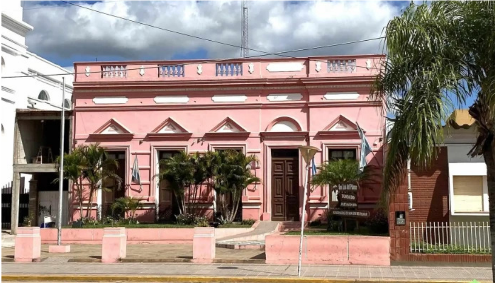
Banco de la nacion argentina instagram