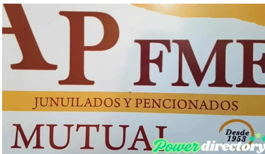
Mutual fray m esqui videos