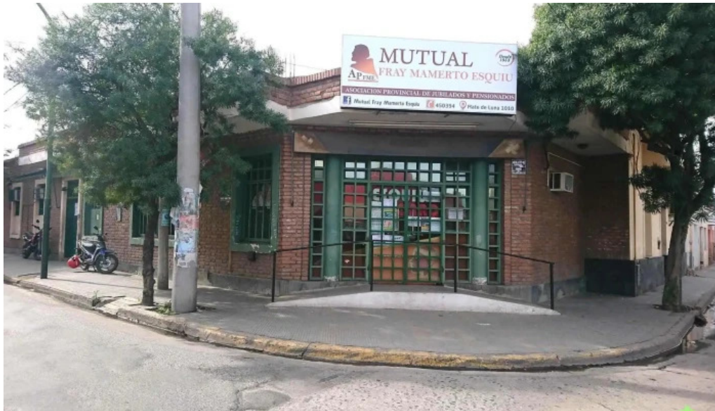
Mutual fray m esquiú del propietario