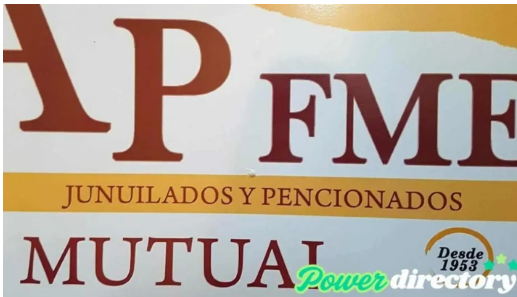
Mutual fray m esqui san fernando del valle de catamarca