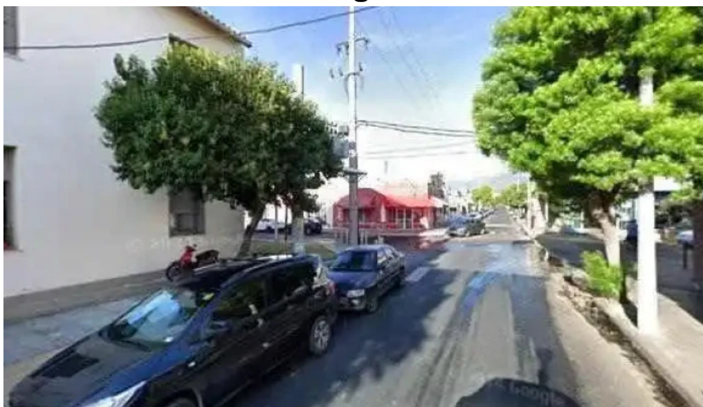
Mutual fray m esqui videosdeg