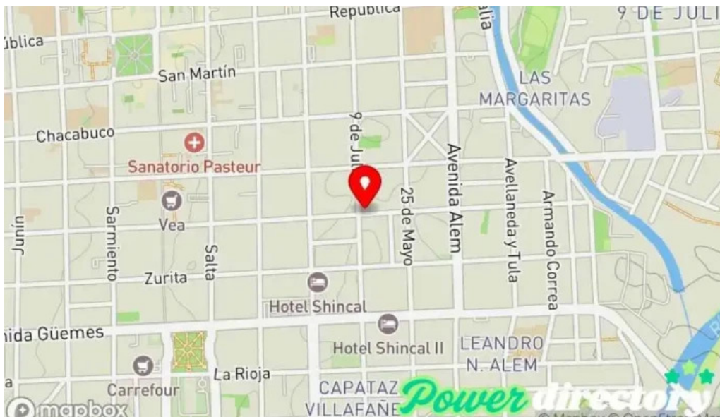
Mutual fray m esqui mapa