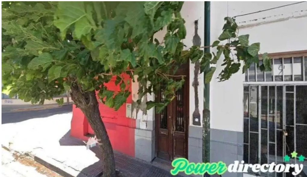
Credi ya san fernando del valle de catamarca