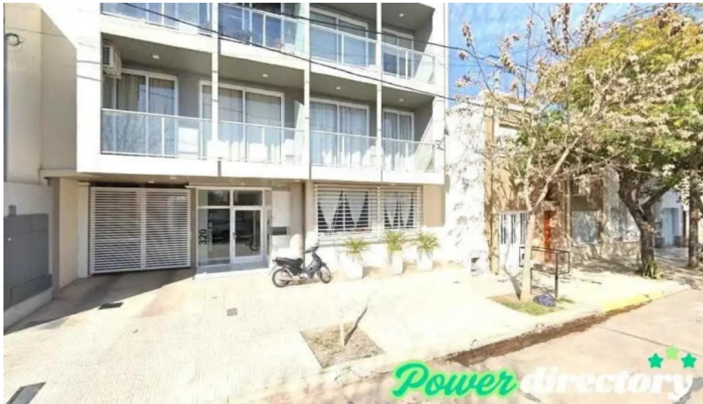
Creditos del plata rafaela