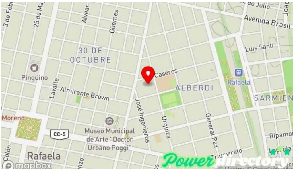
Creditos del plata mapa