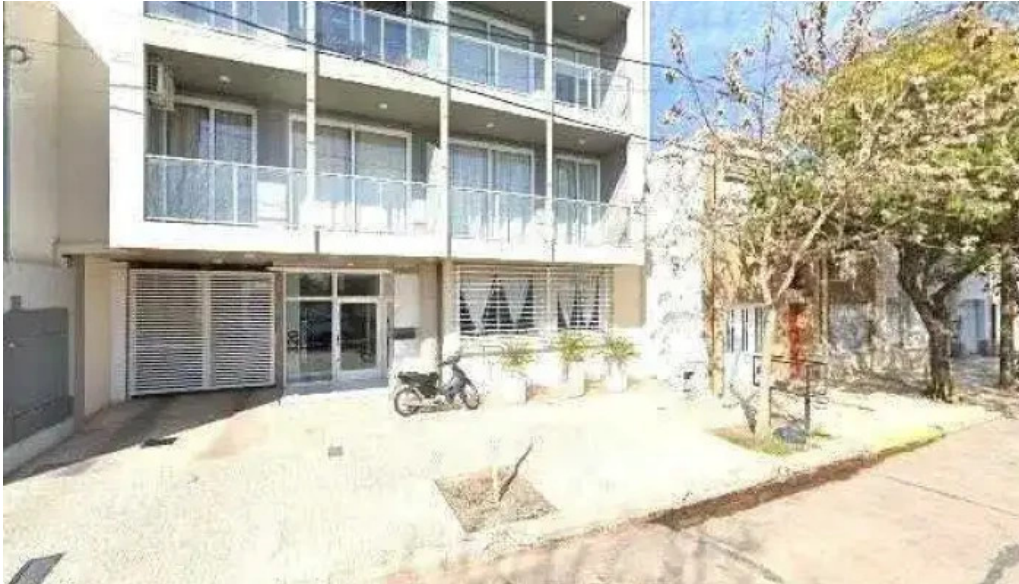
Creditos del plata comentarios