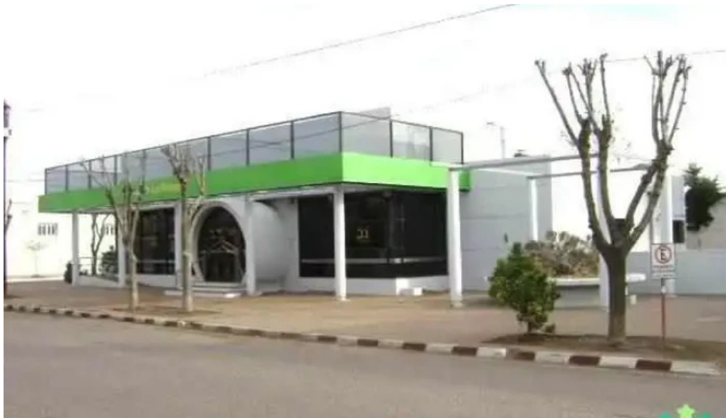
Banco de la pampa quemu quemu precios