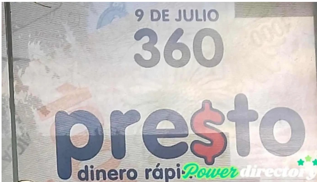
Presto madryn comentarios