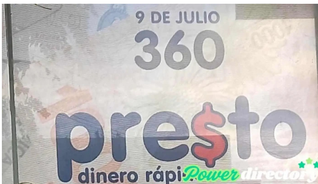
Presto madryn puerto madryn