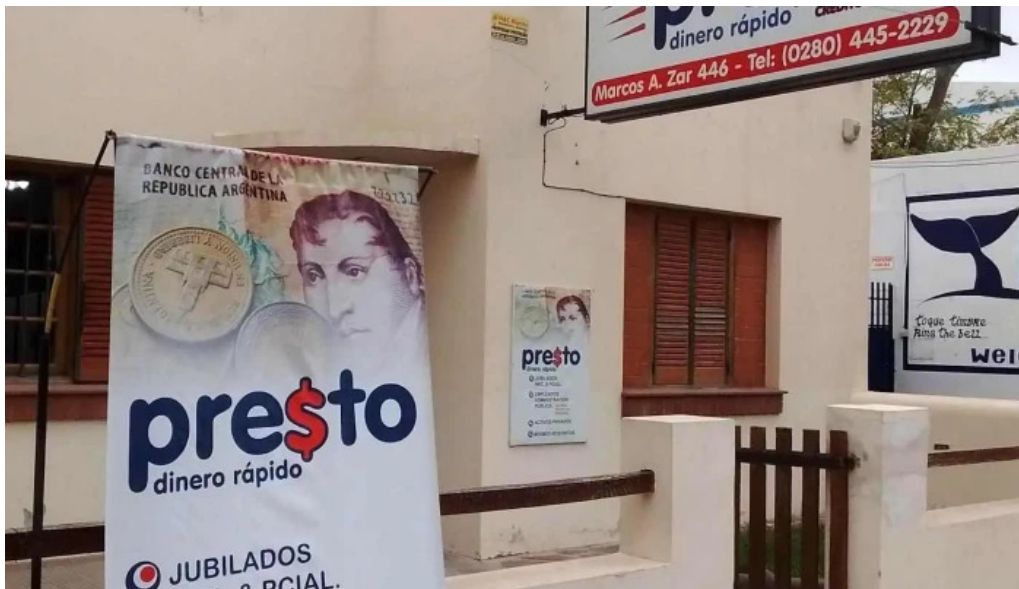
Presto madryn exterior