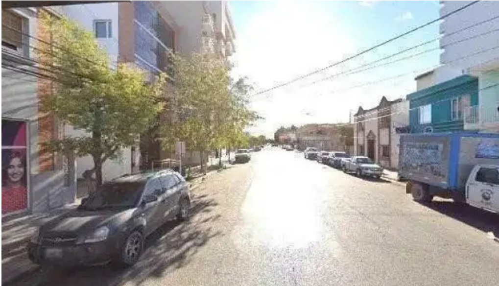
Presto madryn comentariosdeg