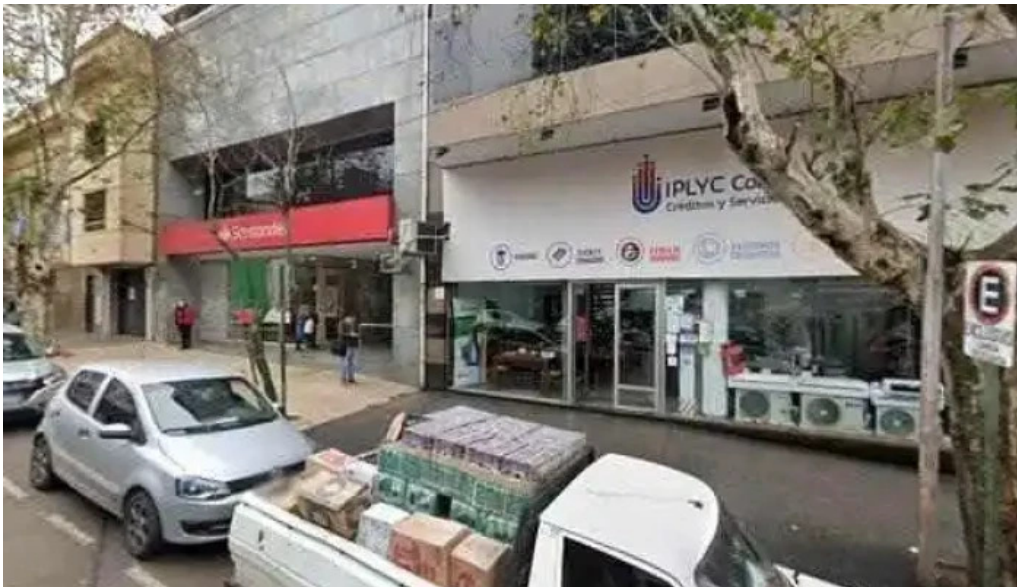
Iplyc confort creditos y servicios sociedad del estado telefono