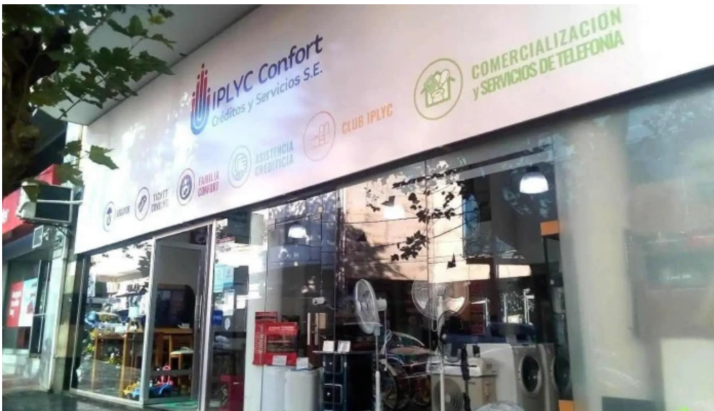
Iplyc confort creditos y servicios sociedad del estado posadas