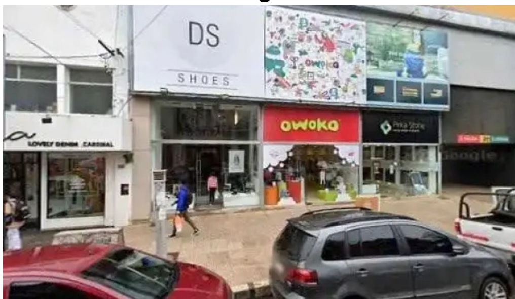
Credito azteca telefono