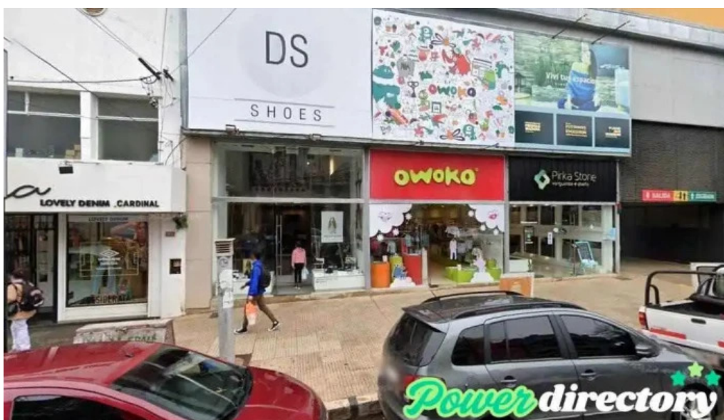
Credito azteca posadas