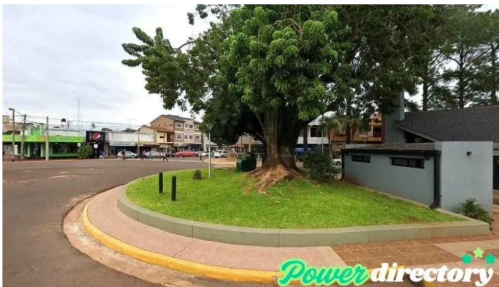
Cooperativa palmares obra