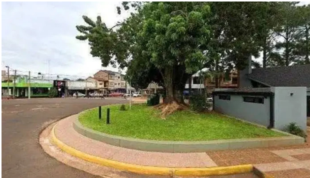
Cooperativa palmares puntaje