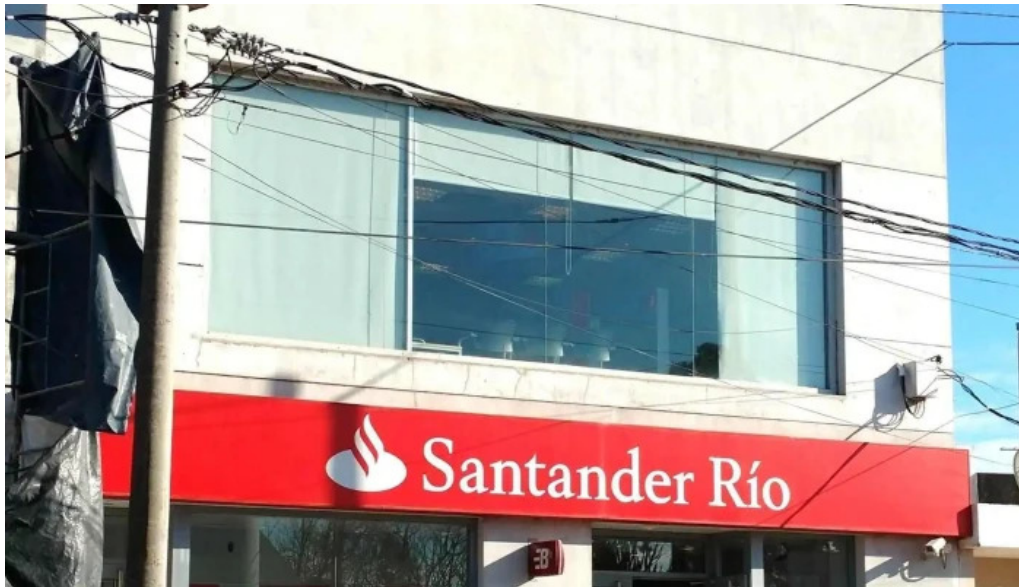
Banco santander puntaje