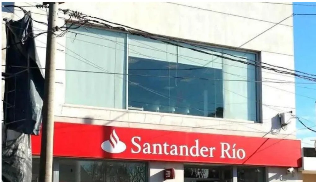
Banco santander monte maiz