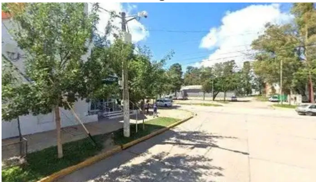
Banco santander puntajedeg