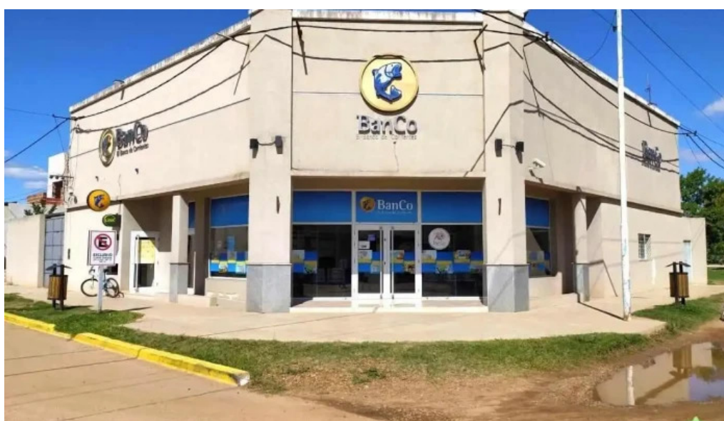
Banco de corrientes s a mocoreta