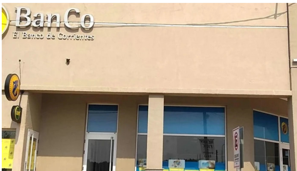
Banco de corrientes sa como llegar