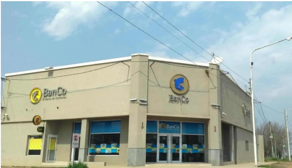
Banco de corrientes sa mocoreta