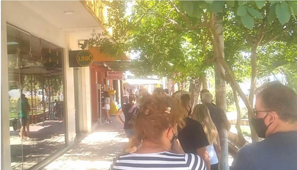
Banco de la nacion argentina mina clavero