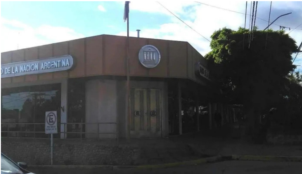
Banco de la nacion argentina numero