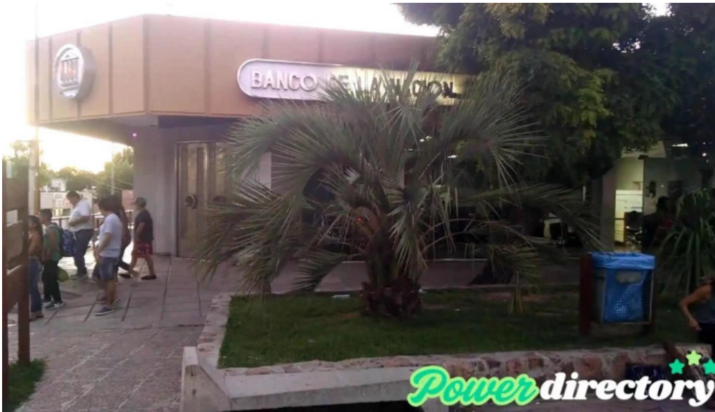
Banco de la nacion argentina videos