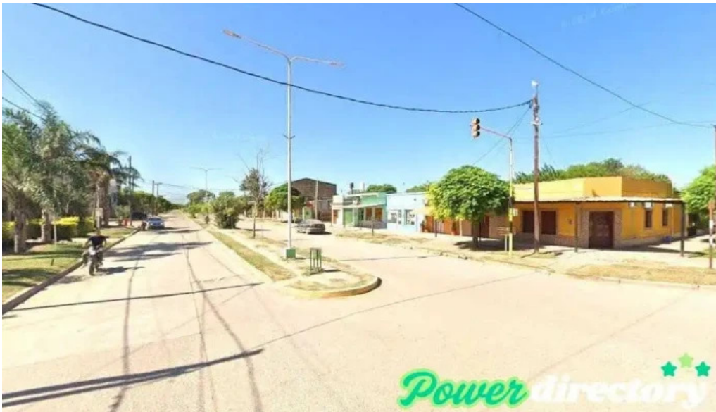
Banco santiago del estero sucursal los juries los juries