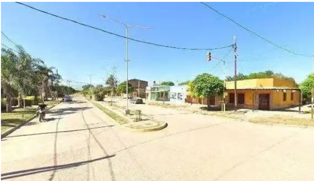
Banco santiago del estero sucursal los juries ubicacion