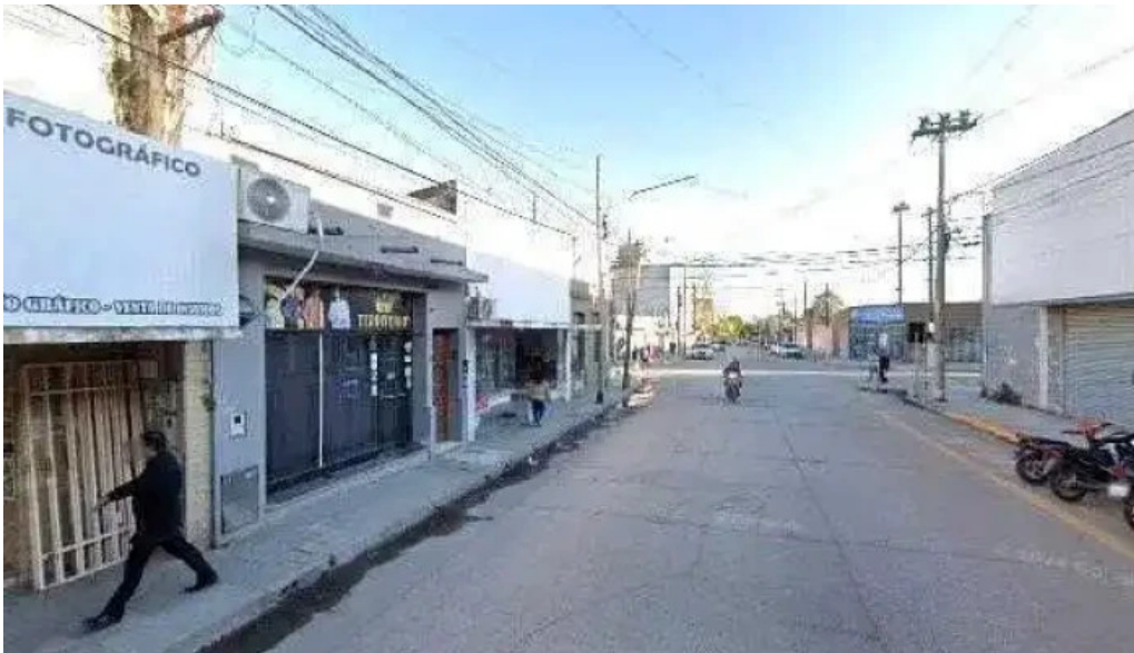
Tarjeta credicash precios