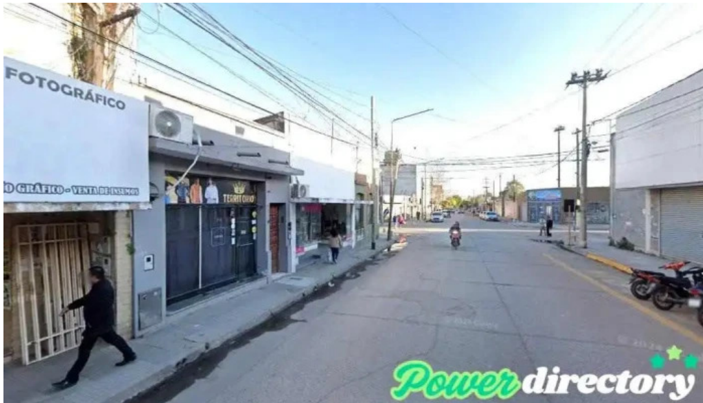
Tarjeta credicash libertador gral san martin