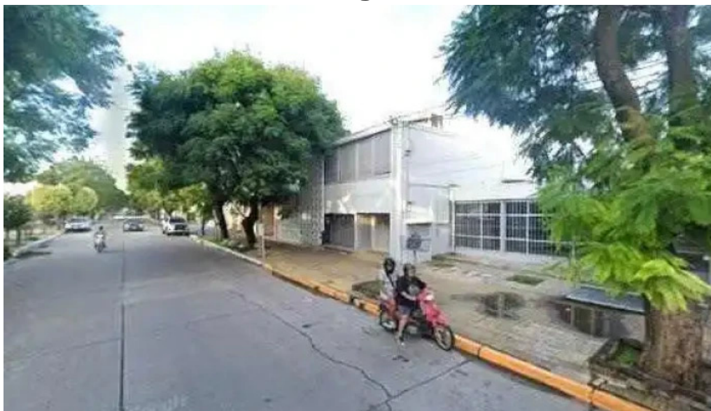
Banco de la nacion argentina videos