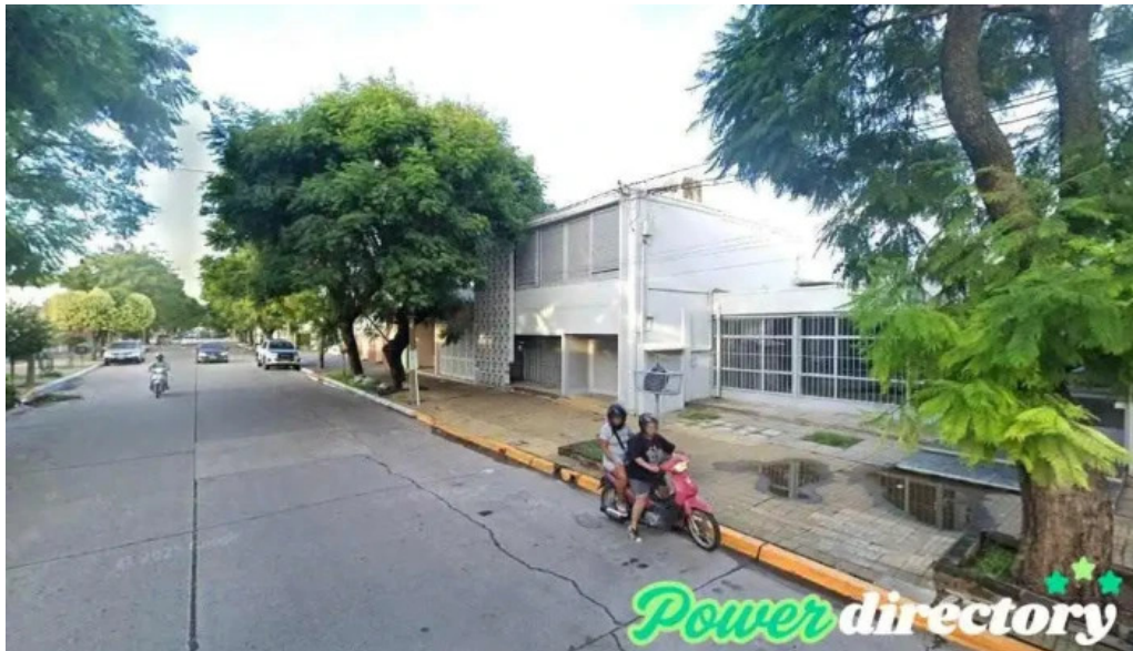
Banco de la nacion argentina leones