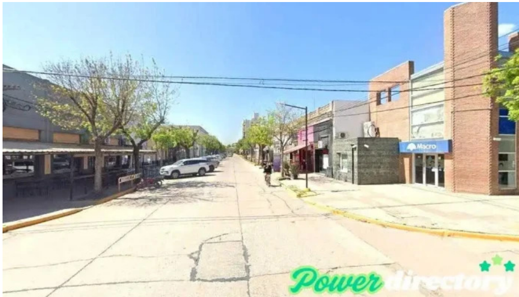
Macro sucursal las rosas las rosas