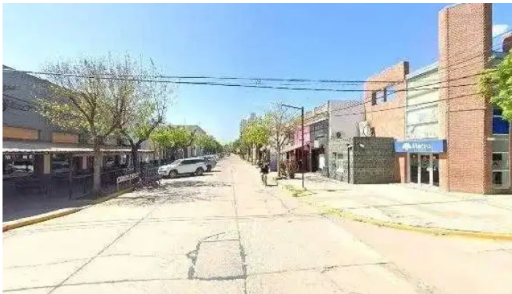
Macro sucursal las rosas abierto ahora