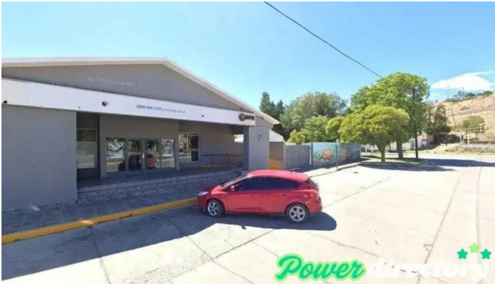
Banco bpn las lajas