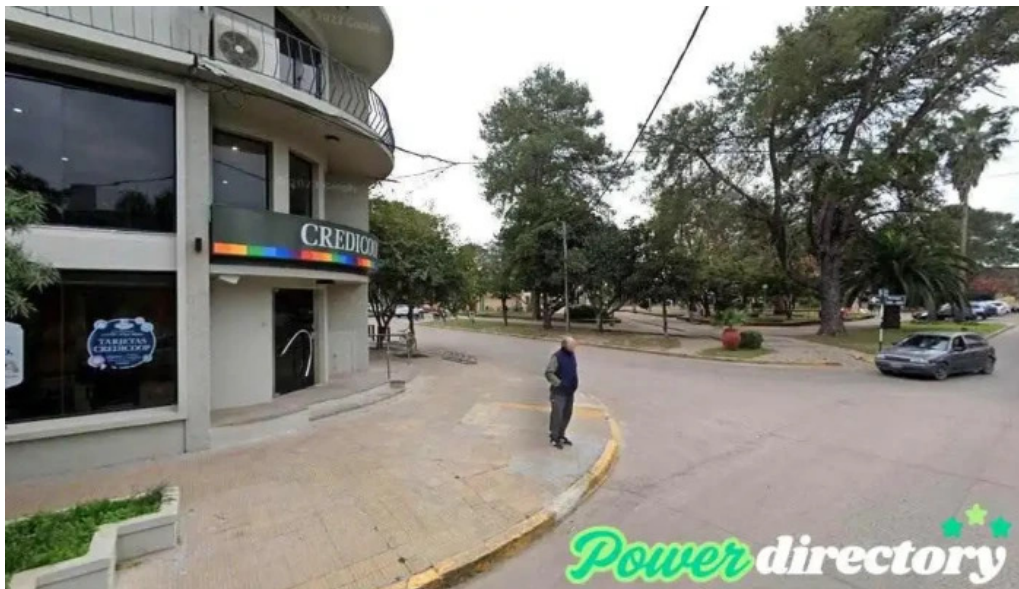
Banco credicoop laguna paiva