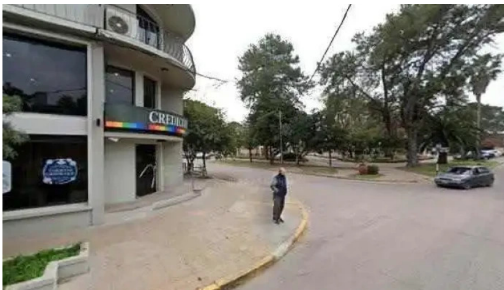
Banco credicoop fotos