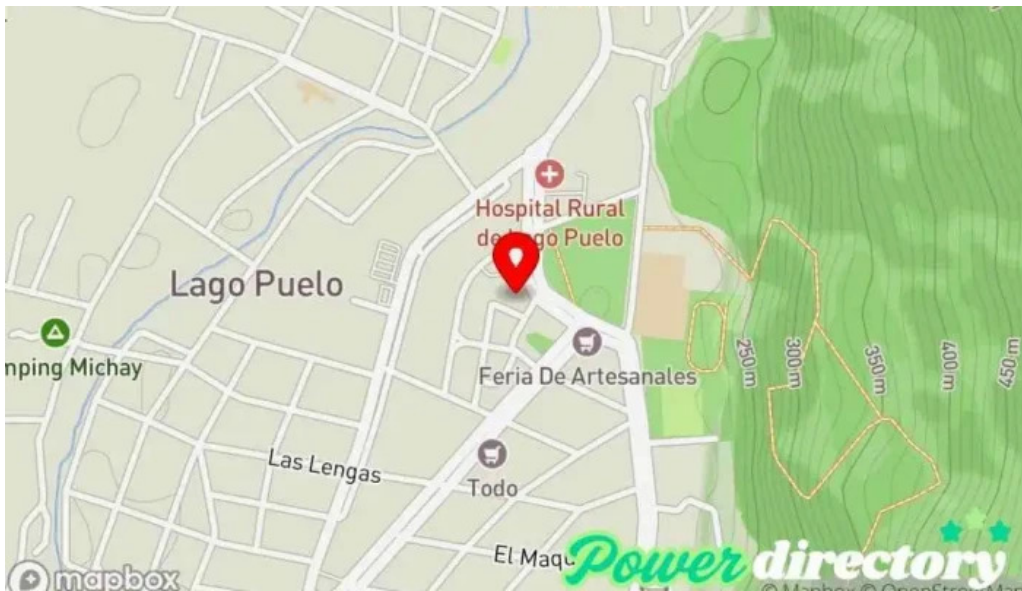
Banco del chubut mapa