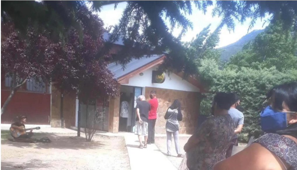
Banco del chubut lago puelo