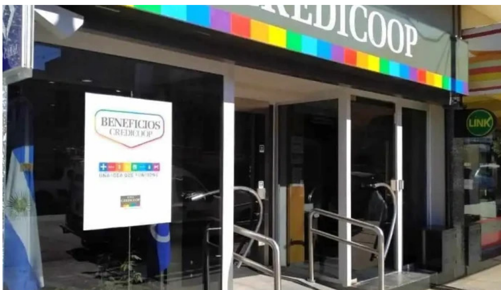
Banco credicoop exterior