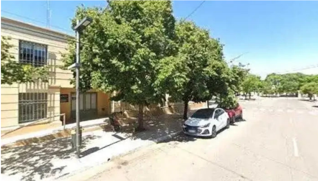
Banco credicoop fotosdeg