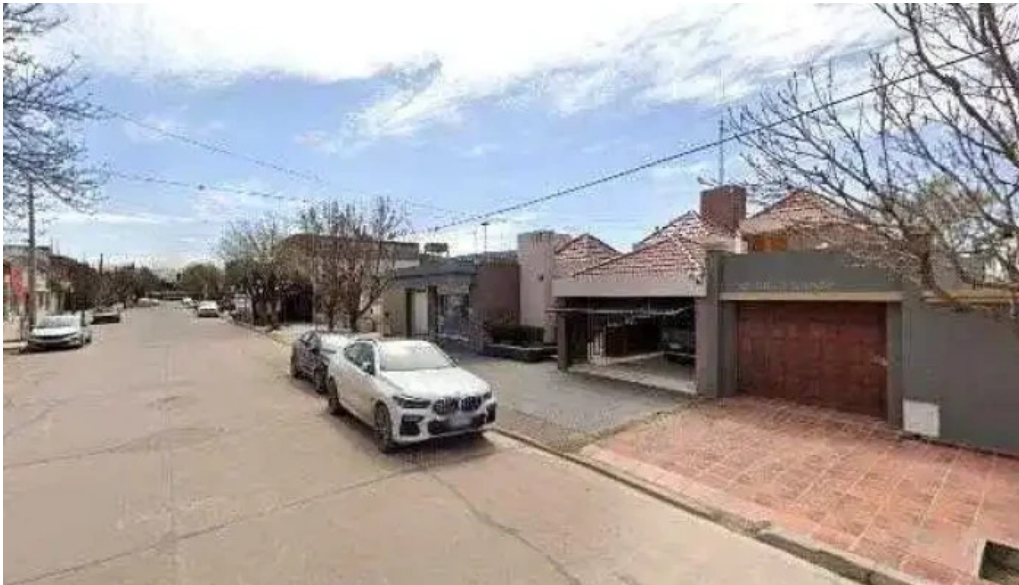
Clenel sh credito inmediato ubicacion