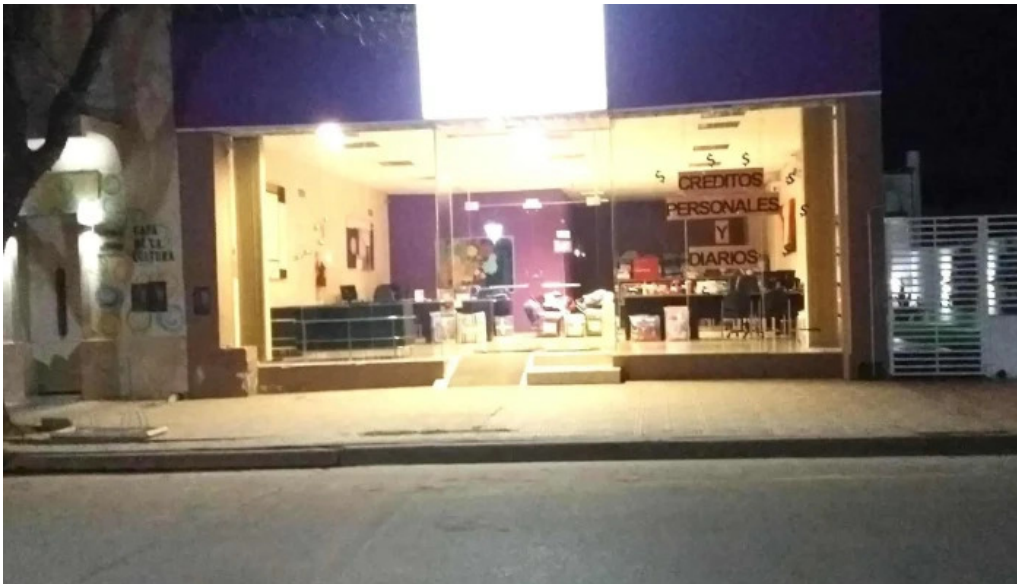
Clenel sh credito inmediato gral cabrera