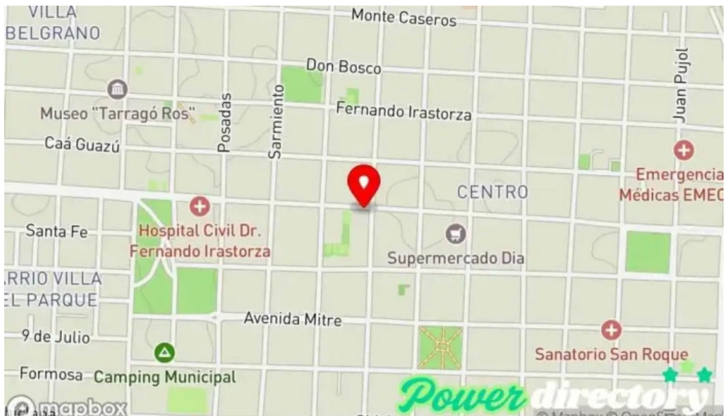
Banco de corrientes sa mapa