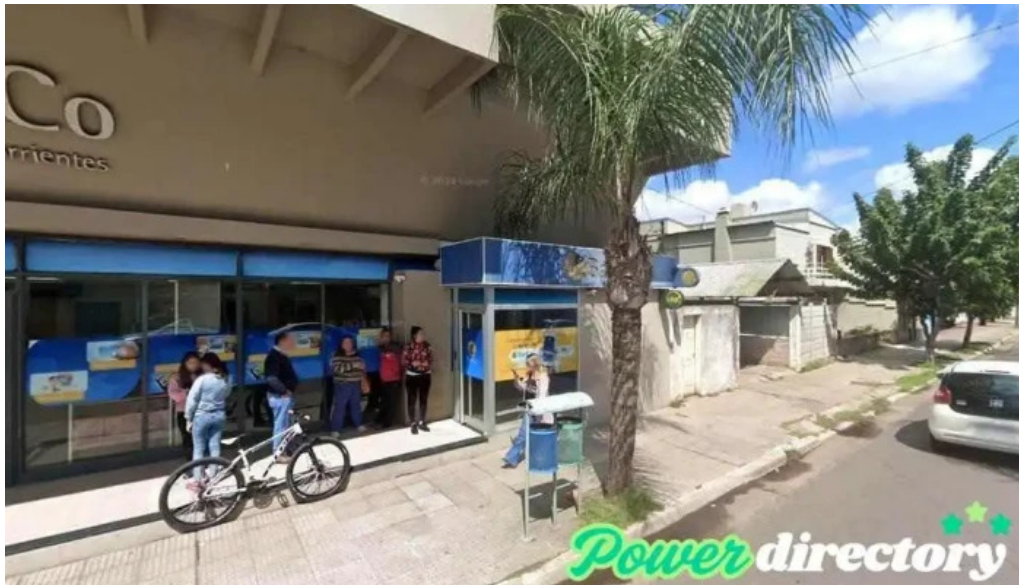
Banco de corrientes s a curuzu cuatia