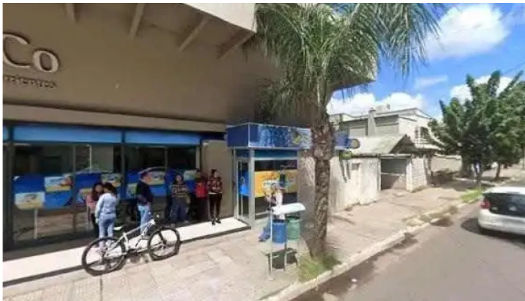
Banco de corrientes sa catalogo