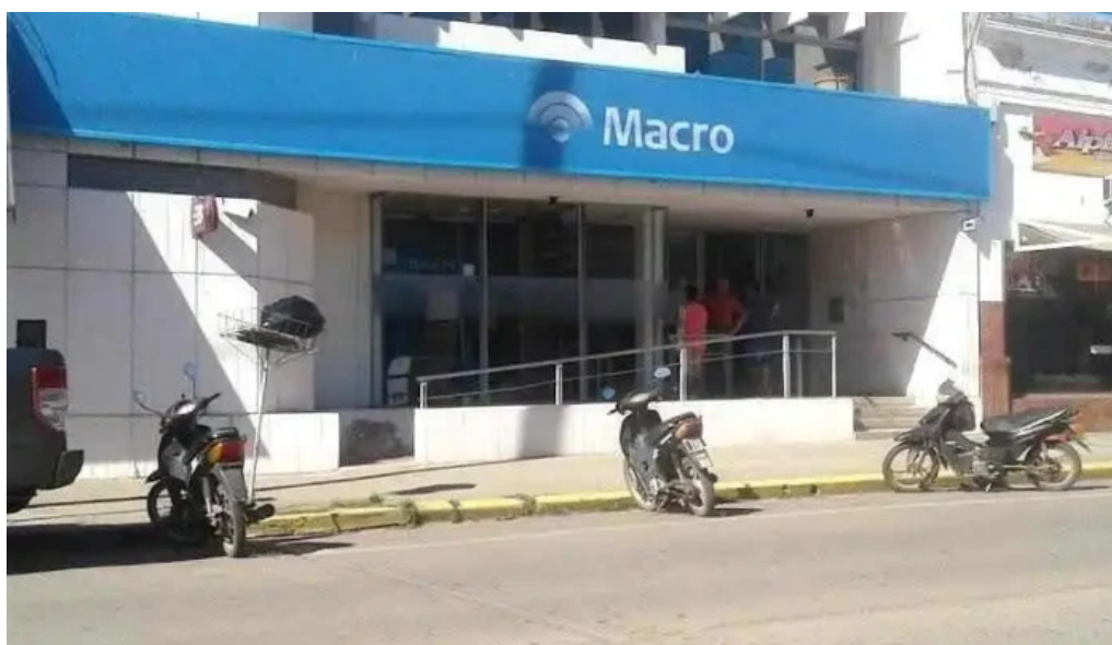
Macro sucursal cruz alta cruz alta