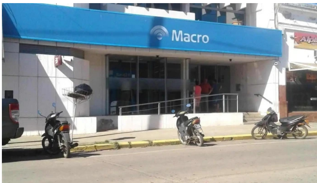
Macro sucursal cruz alta donde