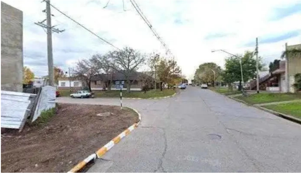
Banco de la nacion argentina horariodeg