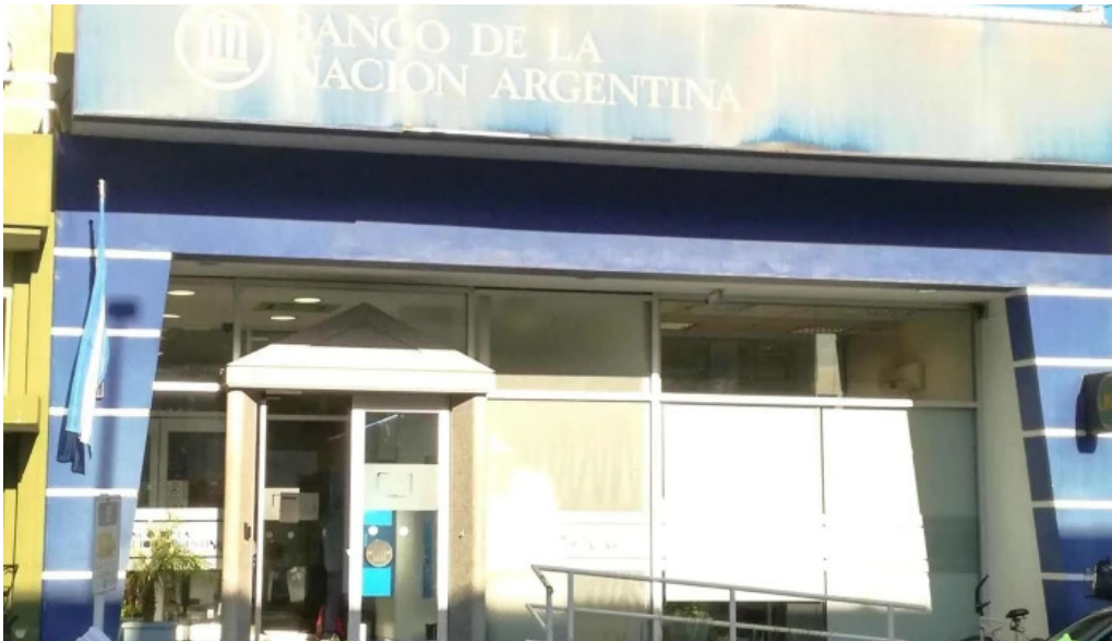
Banco de la nacion argentina horario