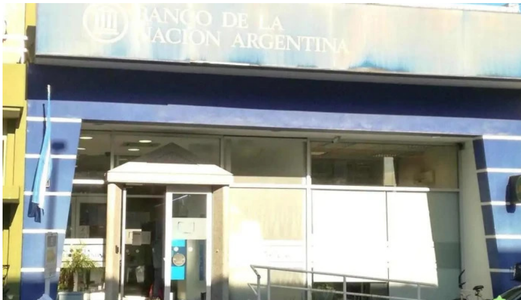
Banco de la nacion argentina crespo