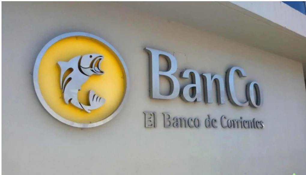
Banco el banco de corrientes fotos