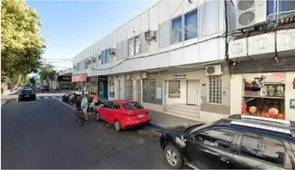
Amint prestamos sitio web