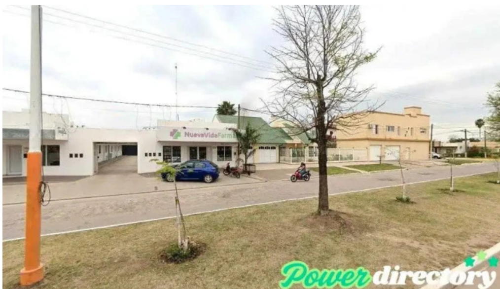
Nuevo banco del chaco coronel du graty