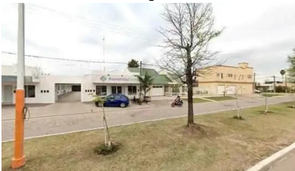
Nuevo banco del chaco zona