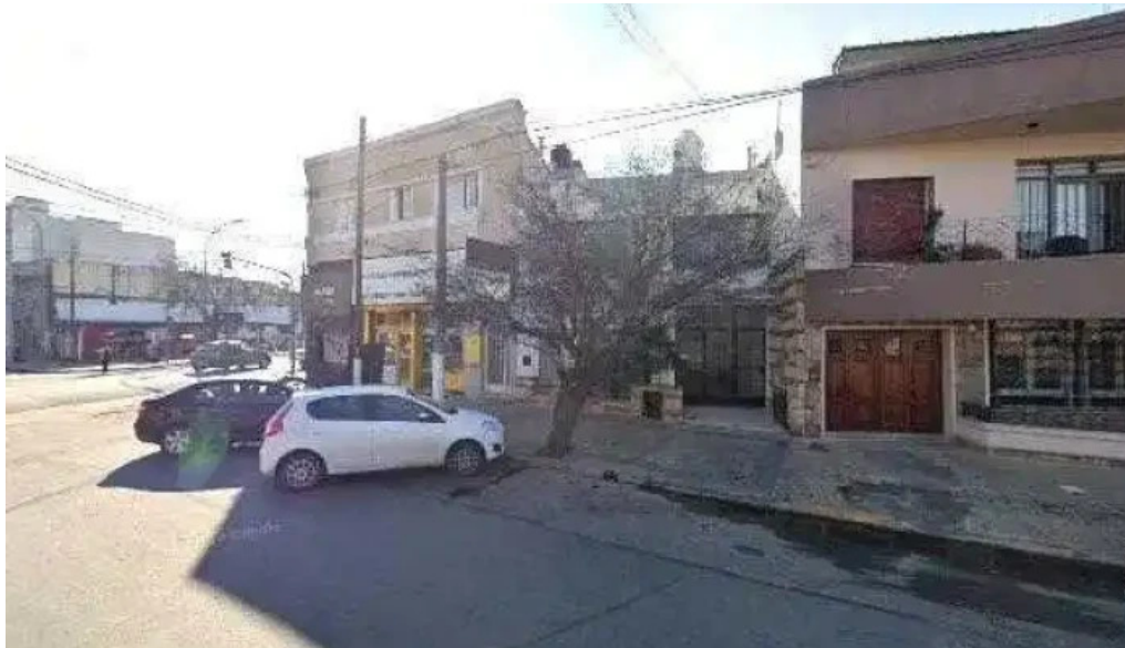
Creditos sitio web