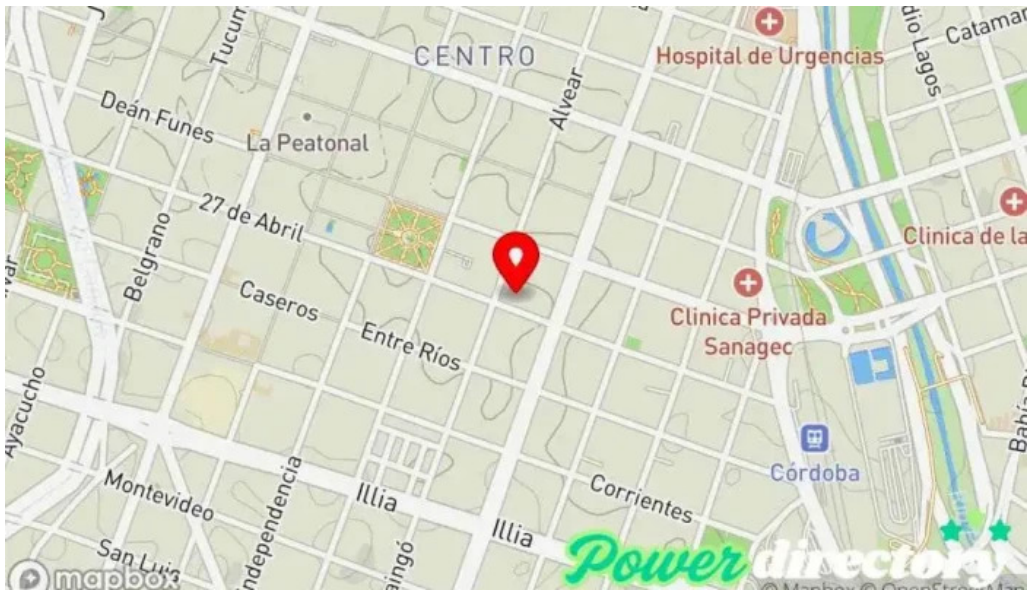
Banco santiago del estero sucursal cordoba mapa