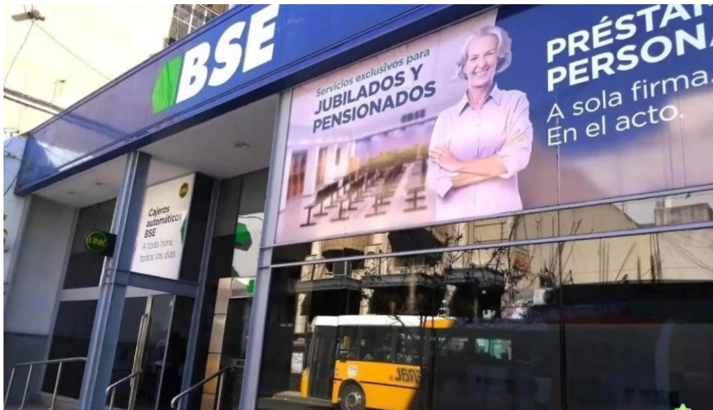
Banco santiago del estero sucursal cordoba cordoba