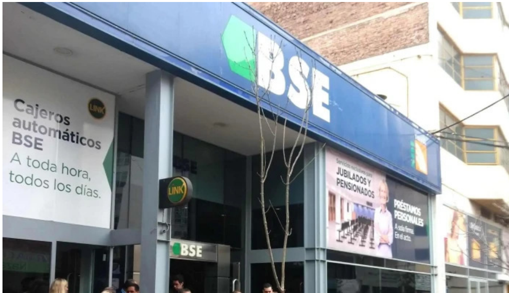
Banco santiago del estero sucursal cordoba descuentos