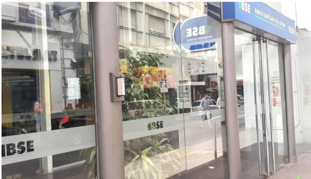
Banco santiago del estero sucursal cordoba exterior