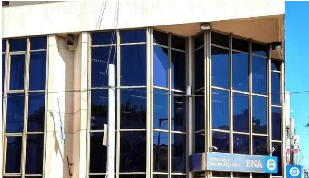
Banco de la nacion argentina cordoba