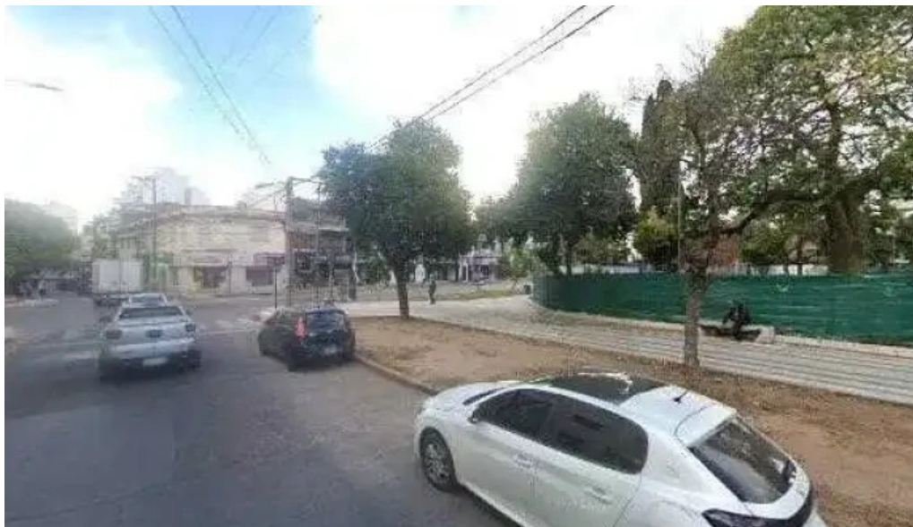
Banco de la nacion argentina cerca de mi