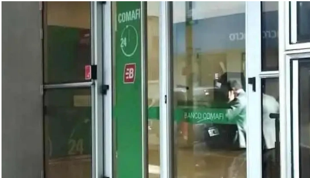
Banco comafi cordoba