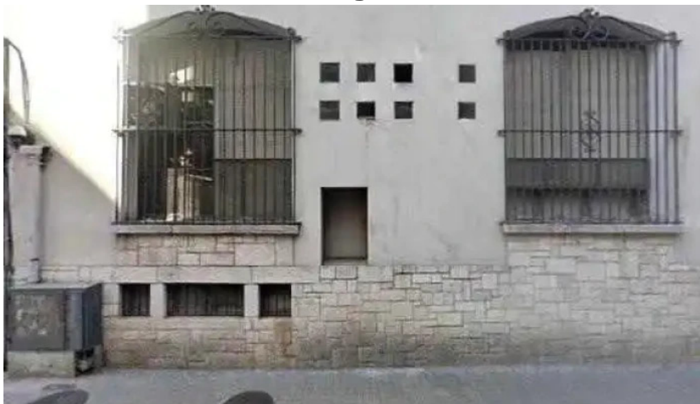
Banco comafi sitio webdeg