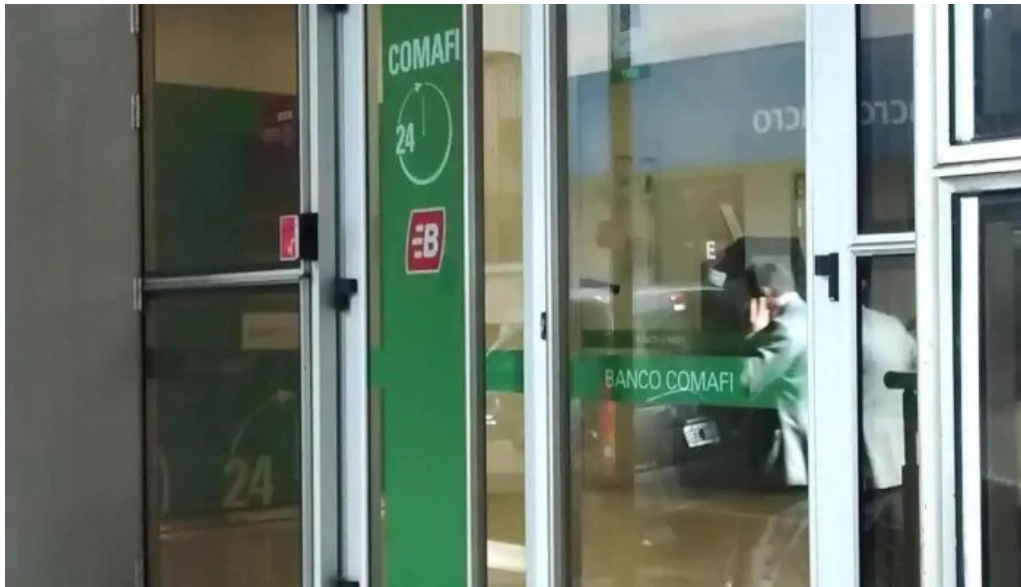
Banco comafi sitio web