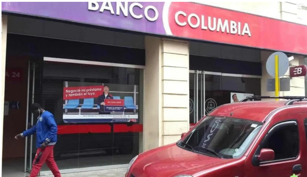
Banco columbia cordoba