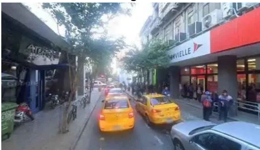
Banco columbia videos