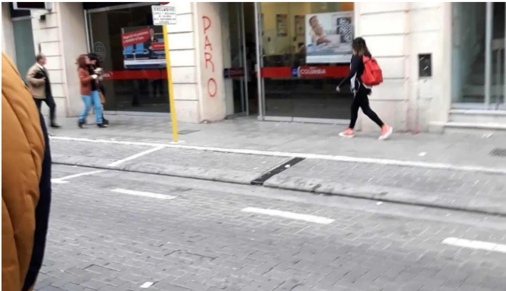
Banco columbia exterior