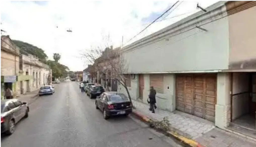
Caja mixta telefono