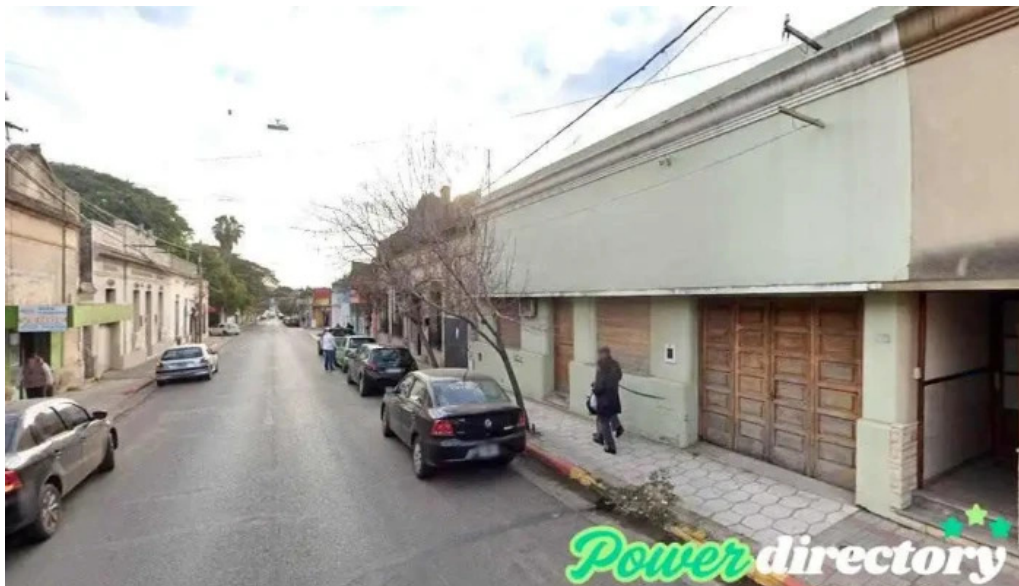
Caja mixta concordia