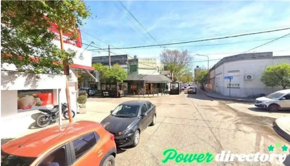
Entre rios servicios concepcion del uruguay