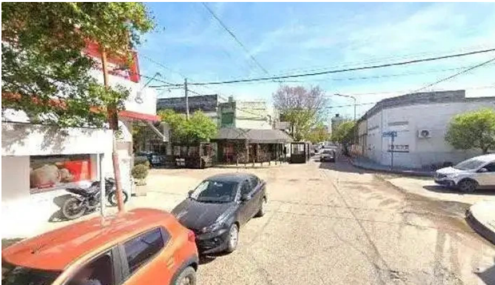
Entre rios servicios precios