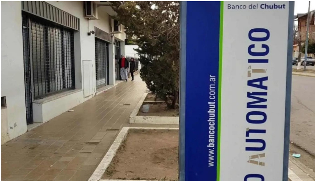
Banco del chubut sucursal barrio pueyrredon numero