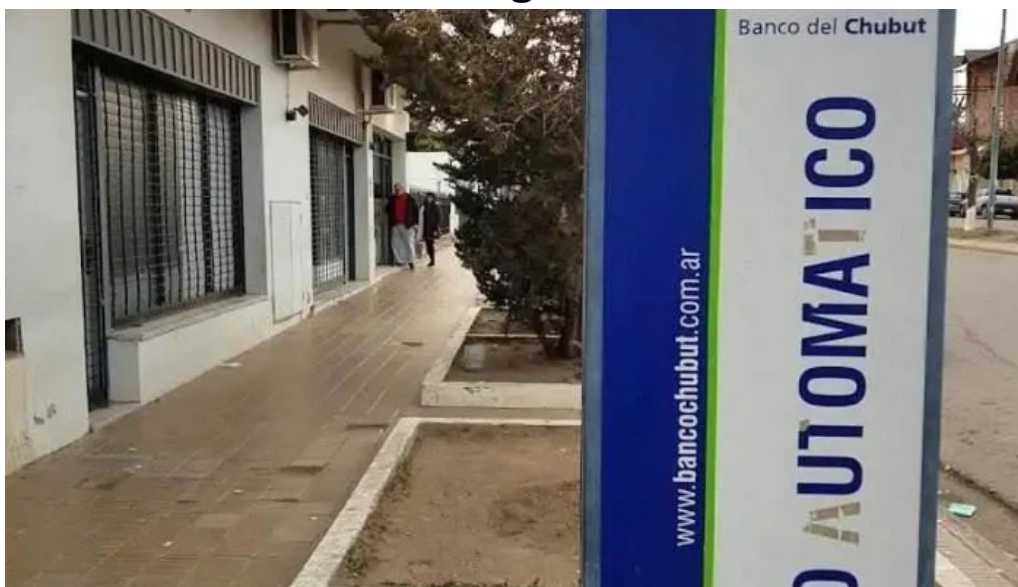
Banco del chubut • sucursal barrio pueyrredon comodoro rivadavia