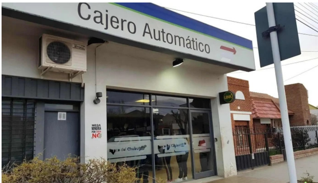
Banco del chubut sucursal barrio pueyrredon exterior