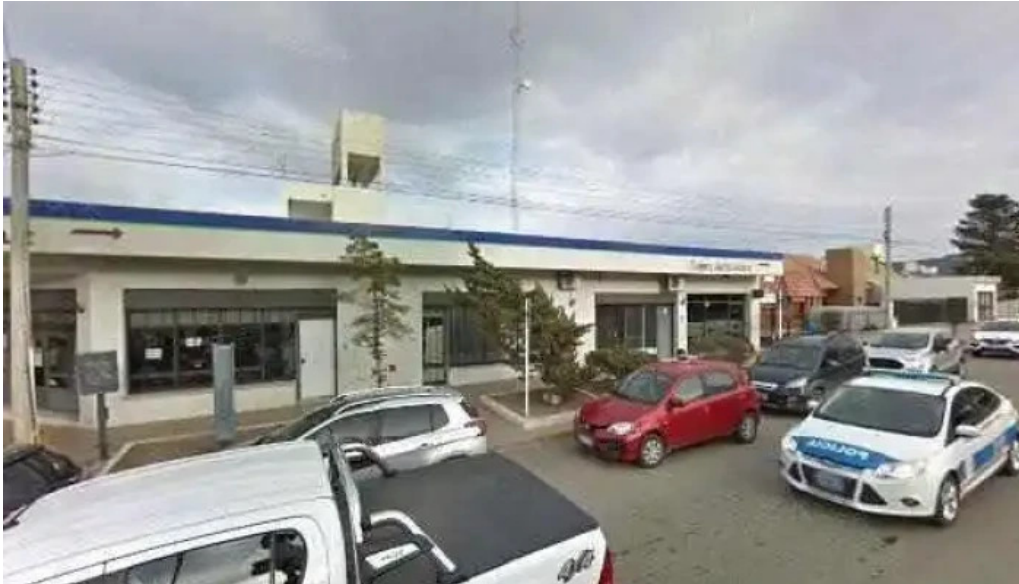
Banco del chubut sucursal barrio pueyrredon numerodeg