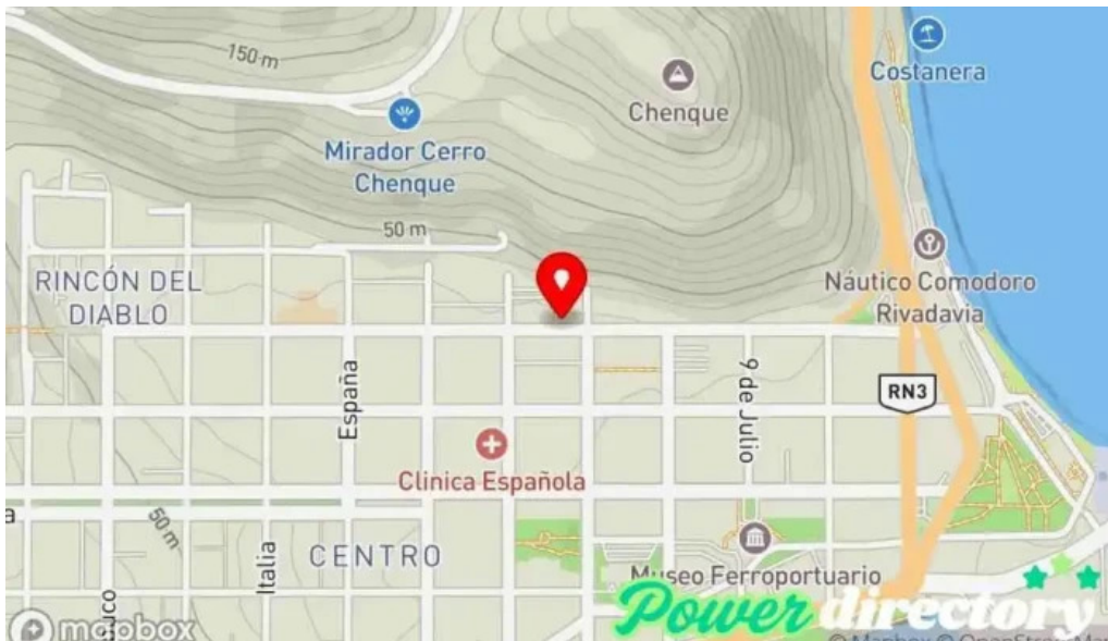
Asociacion mutual union federal mapa