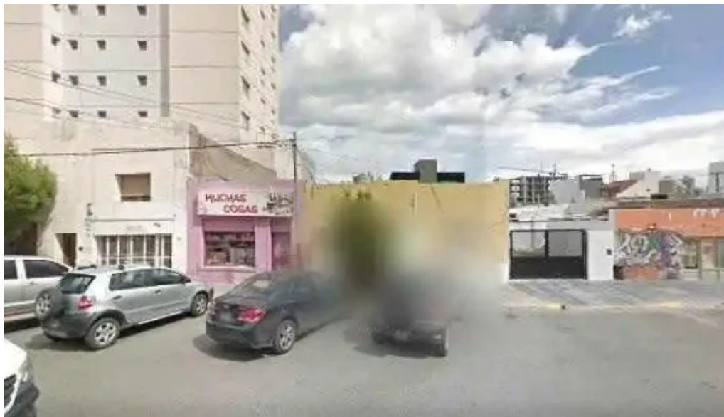
Asociacion mutual union federal descuentos