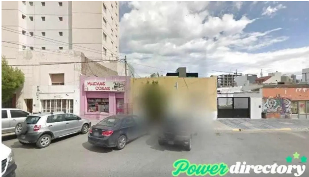
Asociacion mutual union federal comodoro rivadavia