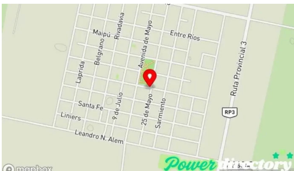
Banco de la provincia de cordoba col san bartolome