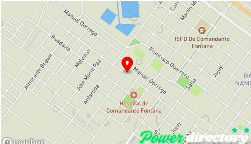
Banco formosa sucursal mapa