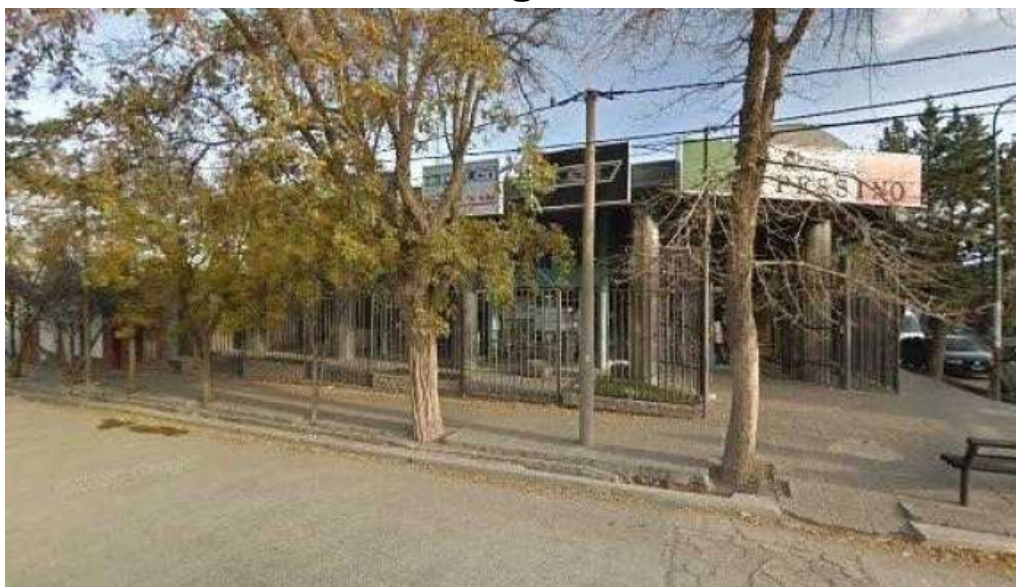
Banco de la nacion argentina precios