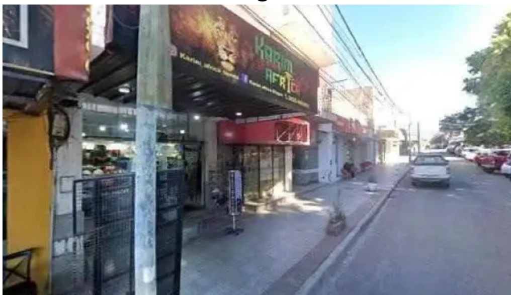
Macro sucursal chilecito telefono