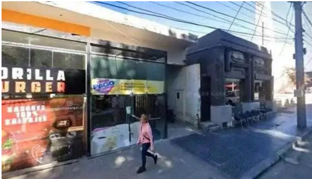
Banco patagonia sucursal chilecito descuentosdeg