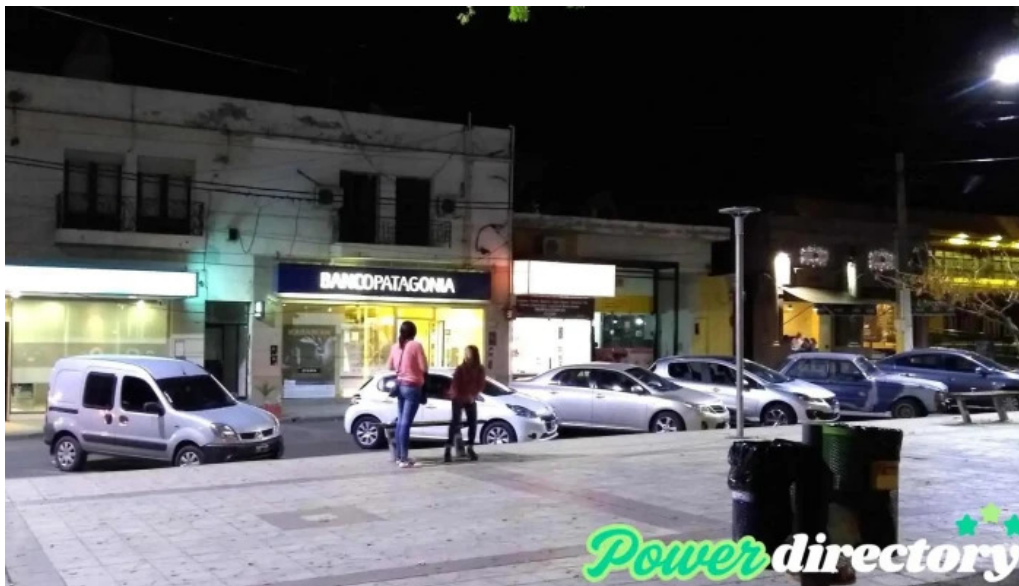
Banco patagonia sucursal chilecito chilecito