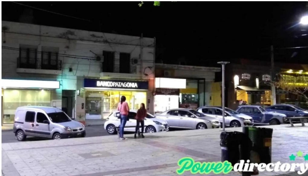
Banco patagonia sucursal chilecito descuentos