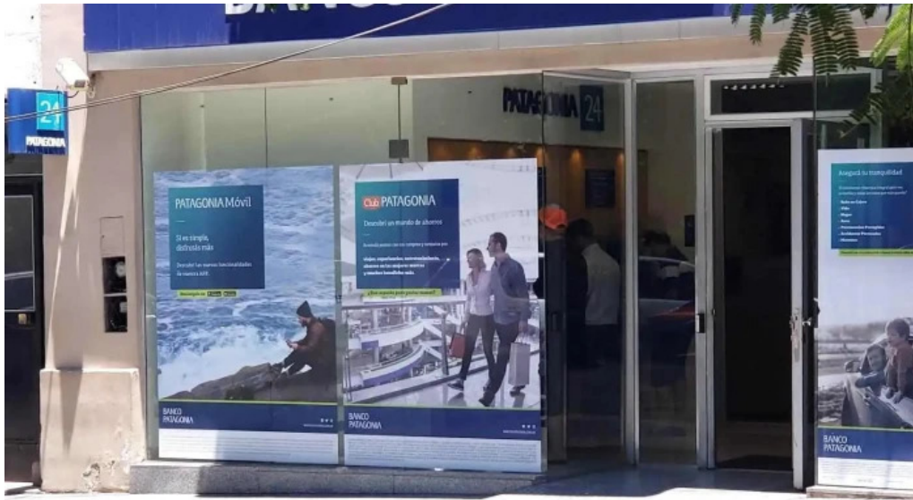
Banco patagonia sucursal chilecito exterior