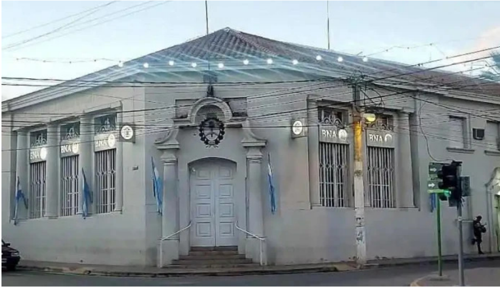
Banco de la nacion argentina sucursal chilecito chilecito