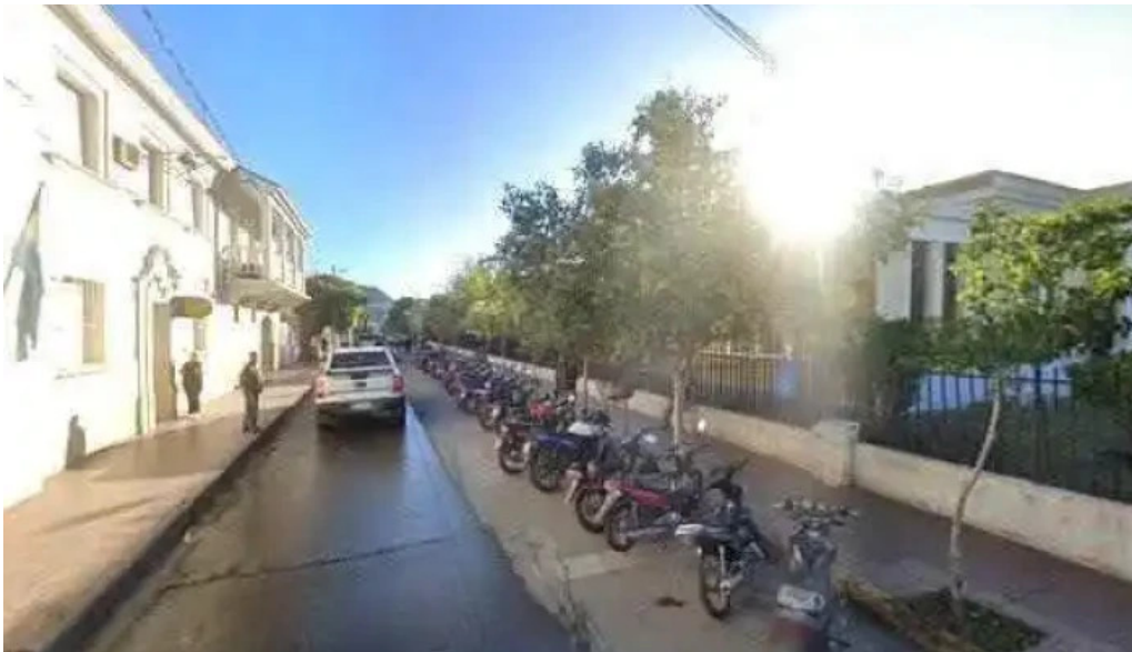
Banco de la nacion argentina sucursal chilecito cerca de mideg