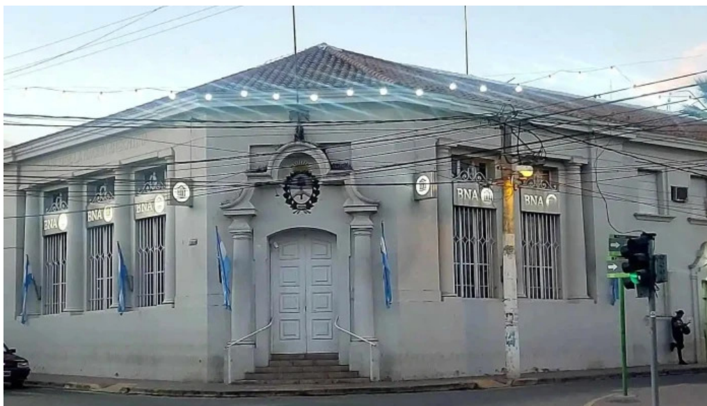
Banco de la nacion argentina sucursal chilecito cerca de mi