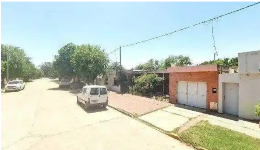
Banco de la provincia de cordoba como llegar