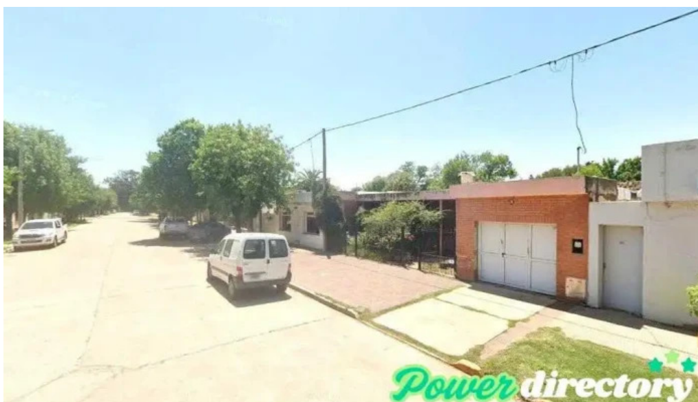
Banco de la provincia de cordoba chazon