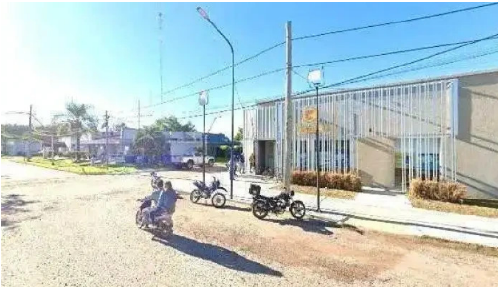
Banco de corrientes sa direcciondeg