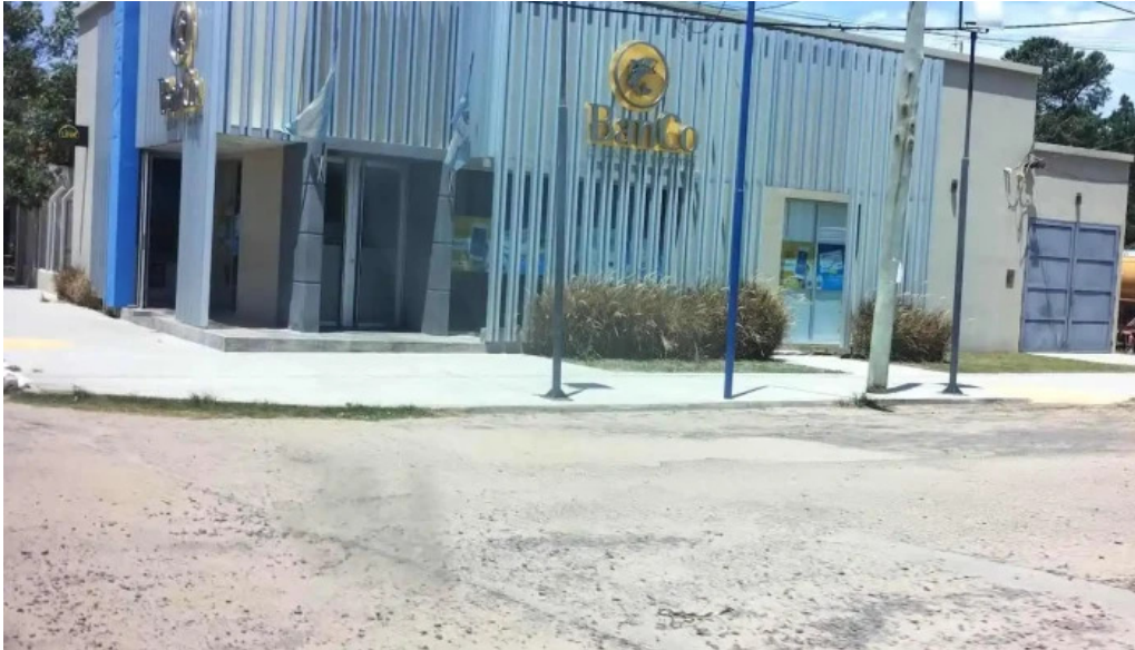
Banco de corrientes sa direccion