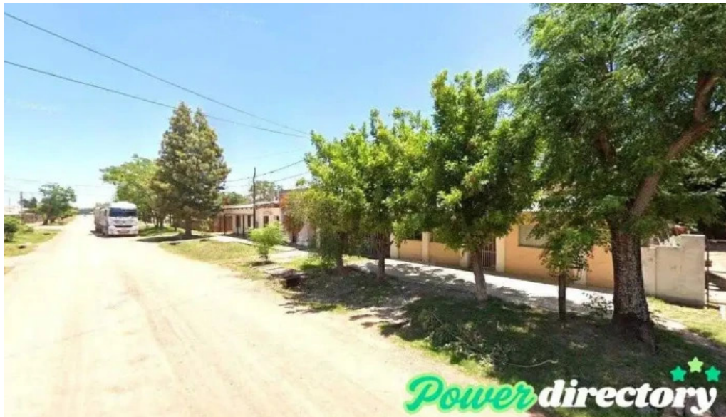
Credito azteca srl charata