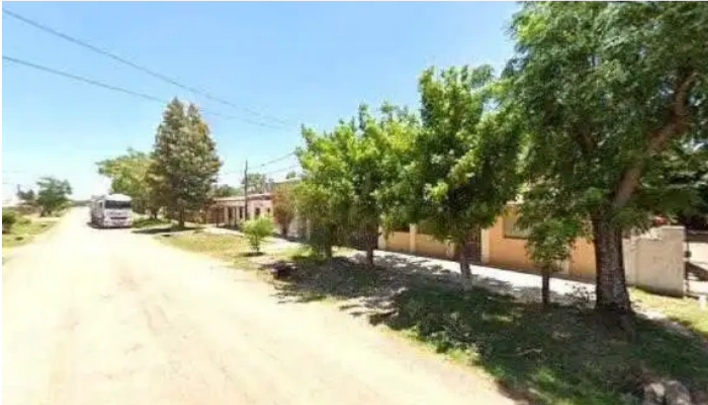
Credito azteca srl sitio web