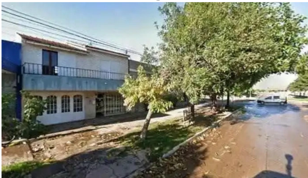
Mutual del club ucyd sitio web