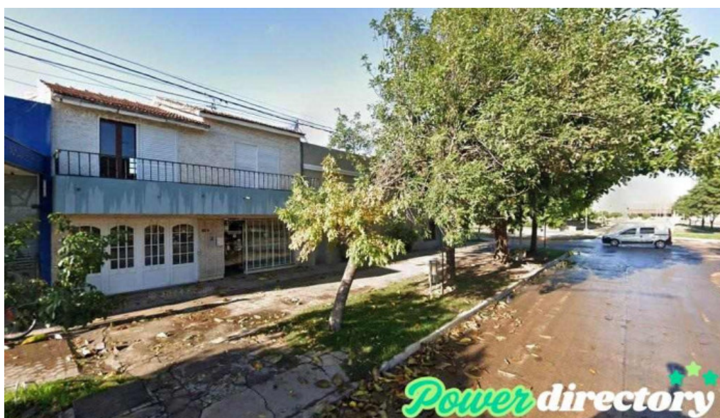
Mutual del club ucyd ceres